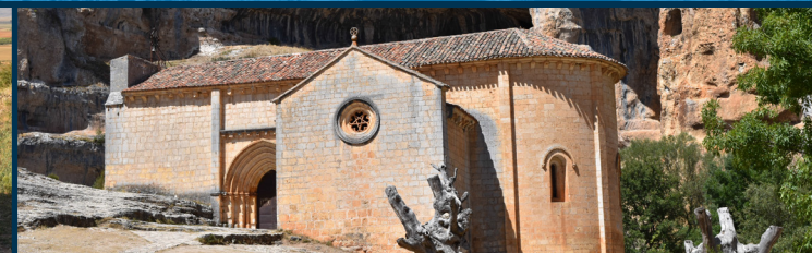
La ermita de San Bartolomé