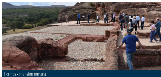
Tiermes - mansión romana

Explora los tres yacimientos celtibero-romanos más importantes de la meseta norte, Tiermes, Uxama y Numancia, y conoce de primera mano este rincón de Hispania y su proceso de integración al Imperio Romano.