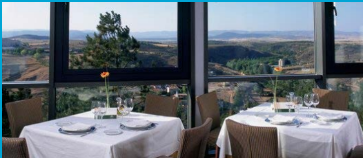
Parador de Soria

Soria es una provincia que goza de un hermoso entorno natural. Para aprovecharlo las jornadas 4 y 10 están dedicadas a tiempo de ocio. Podrás participar en una actividad al aire libre: yendo en bici, haciendo senderismo, bajando el Duero en kayak, o practicando espeleología.