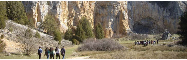
Cañón del Río Lobos