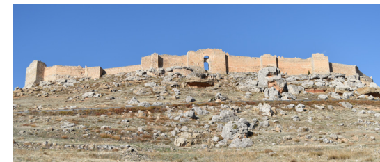
La fortaleza califal de Gormaz

Prepárate a seguir los pasos del Cid, recorriendo el camino de su destierro en San Esteban de Gormaz, Berlanga de Duero o la fortaleza de Gormaz.