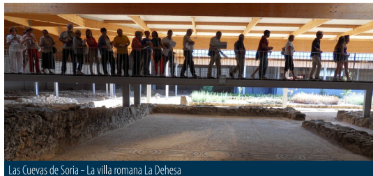
Las Cuevas de Soria - La villa romana La Dehesa

Se redondea el tema de la historia antigua con una excursión a la villa romana de La Dehesa. Como parte de la visita se celebrará un taller de arqueología experimental en el museo Magna Mater.