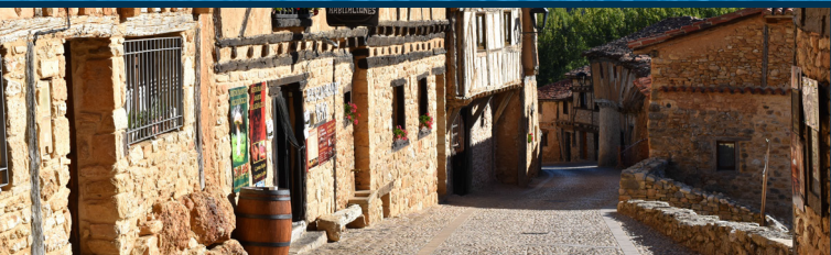
Calatañazor. Conjunto Histórico-Artístico